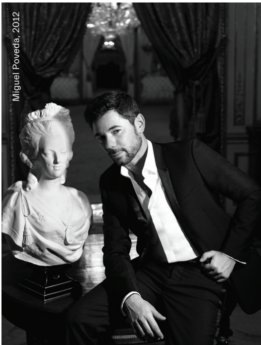
Miguel Poveda, 2012