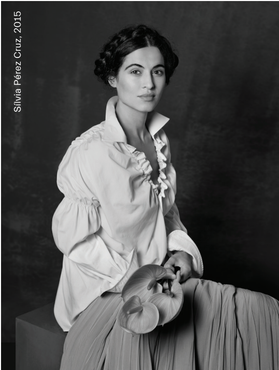
Sílvia Pérez Cruz, 2015