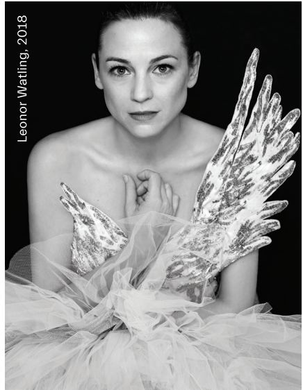
Leonor Watling, 2018

Les parets d'aquesta sala es converteixen temporalment en una partitura en blanc on les notes musicals són una col·lecció de retrats de personalitats del món de la música.